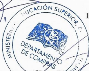
Clara Rivero Encargada de Compras y Contrataciones